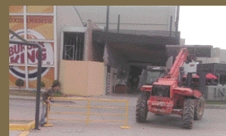
Ayer, una topadora sale del Orfeo y pasa junto a Burger, otra obra del Dino.